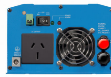
Phoenix Inverter 12/800 with AN/NZS 3112 socket