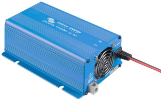
Phoenix Inverter 12/180