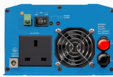
Phoenix Inverter 12/800 with BS 1363 socket