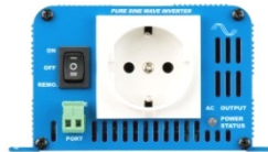
Phoenix Inverter 12/180 with Schuko socket