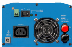
Phoenix Inverter 12/800 with IEC-320 socket