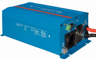
Phoenix Inverter 12/800 with Schuko socket

Veuillez consulter les photos ci-dessous.