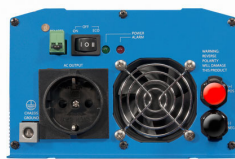
Phoenix Inverter 12/800 with Schuko socket