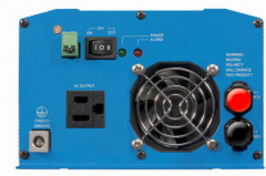
Phoenix Inverter 12/800 with Nema 5-15R socket