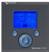
Tableau de commande Blue Power

Une solution pratique et bon marché pour une surveillance à distance, avec un bouton rotatif pour configurer les niveaux de Power Control et Power Assist.