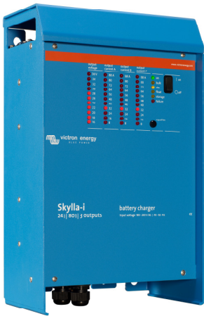
Skylla-i 24/100 (3)