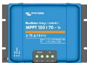
Contrôleur de charge solaire MPPT 150/70-Tr