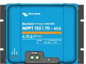
Contrôleur de charge solaire MPPT 150/70 MC4