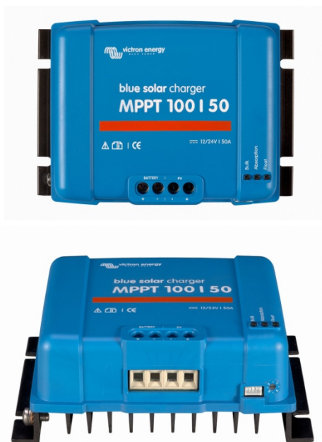
Contrôleur de charge solaire MPPT 100/50